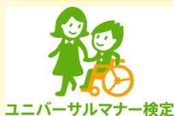
ユニバーサルマナー検定

研修名：ユニバーサルマナー検定 3級 検定料：5500円（認定証が出ます） 受講資格：どなたでも受講いただけます。 申込が必須です。